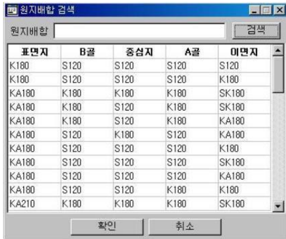
<4-3> 원지배합 버튼 클릭시 배합 선택 화면(원지명 미검색)