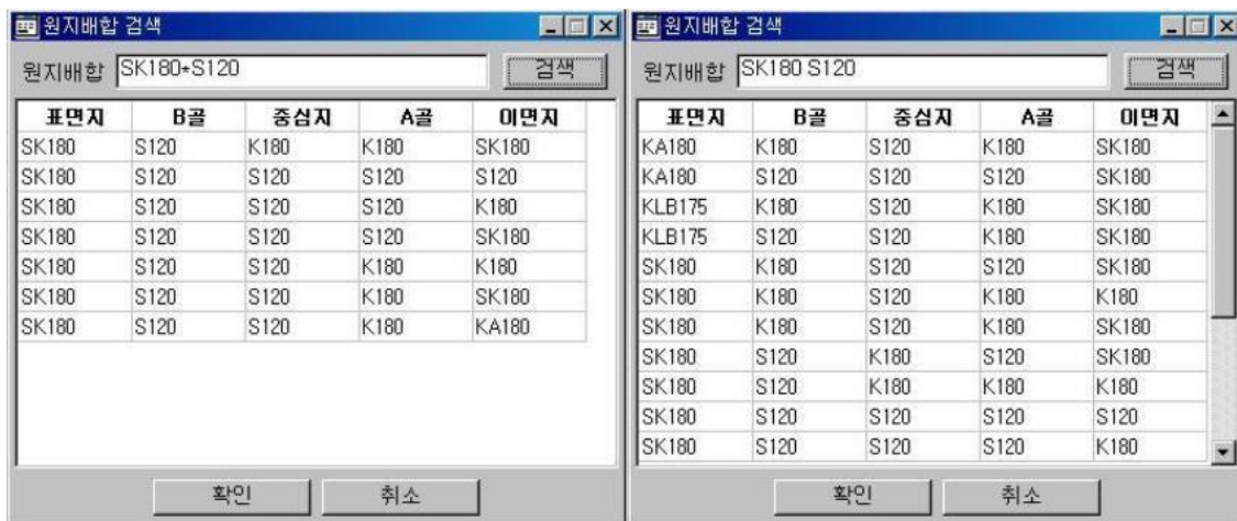
<4-4> 원지배합 버튼 클릭시 배합 선택 화면(원지명 검색)